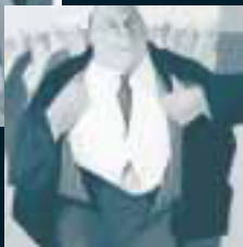
"NUMBER ONE" - 1994 - 100*100 cm