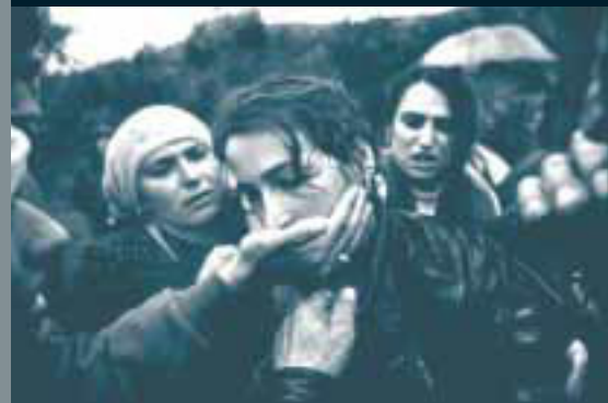
WORLD PRESS PHOTO. Dayana Smith, USA, The Washington Post

"Conversas de mulheres", texto de Ana Cristina Oliveira e encenação de Bibi Perestelo foi a peça que o grupo Ideias do Levante apresentou, em Janeiro, com sucesso, no Teatro da Trindade, atestando a vitalidade do teatro amador do Algarve.