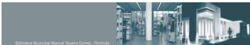
Biblioteca Municipal Manuel Teixeira Gomes - Portimão

A comparticipação no investimento envolve os custos do projecto de arquitectura, construção/adaptação do edifício, aquisição de mobiliário e equipamento, fundos documentais e informatização dos serviços. As candidaturas foram seleccionadas de acordo com a qualidade técnica das propostas, adequação funcional e adequação às características populacionais do concelho, entre outros critérios. O Algarve passará, assim, a ter nove bibliotecas integradas na rede nacional de bibliotecas municipais, perspectivando-se que até ao ano 2003 todos os concelhos da região tal como o resto do país, estejam dotados de um equipamento desta natureza, o que demonstra o grande empenhamento do Ministério da Cultura em torno da promoção do livro e da leitura.