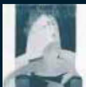
"SALON DES ANGÉS" - 1994 - 200*120 cm